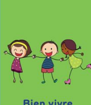
Bien vivre avec les autres