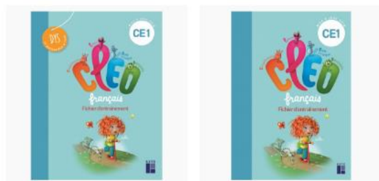
Cléo – Retz – CE1 ou dys – 2019