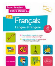
Grand imagier, petits ateliers – FLE – Ed. Ellipses - 2018