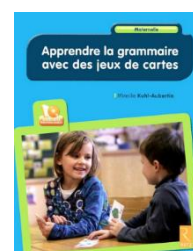
Apprendre la grammaire avec des jeux de cartes Retz – 2018 -