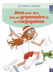
Jeux d'apprentissage de la grammaire et de la conjugaison – Retz – 2020 – Cycle 3