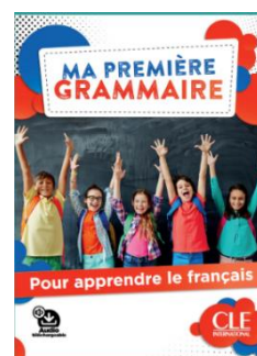
Ma Première Grammaire – Clé Internationale – fichier + audio - Niveau A1-A2 (débutants) – Cycle 3