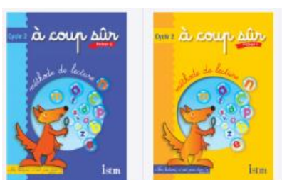
A coup sûr – Istra - fichier I et 2 – 2003 – cycle 2