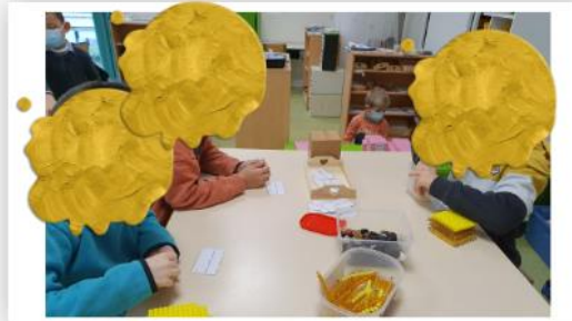
Même matériel mais ateliers différents