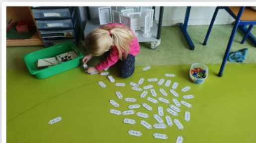
Des ateliers de réinvestissement