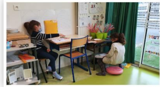
S'installer où l'on se sent bien