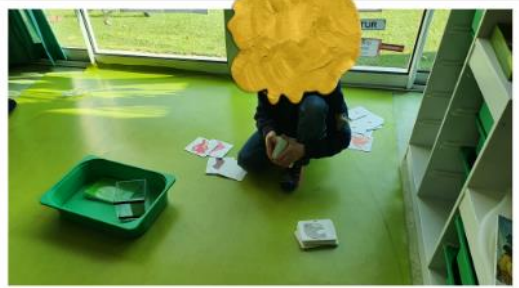
A la découverte du monde