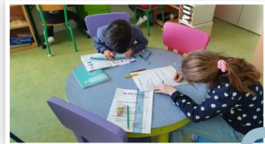
Des activités différentes