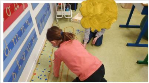
de 0 à 1000 1 CP et 1 CE1