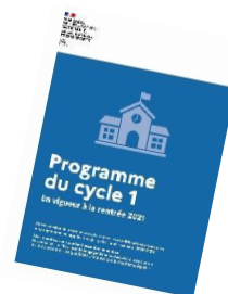
TABLEAU COMPARATIF DES PROGRAMMES 2015/2020/2021 MISE EN EVIDENCE DES CHANGEMENTS 2021

Les modifications portent essentiellement sur le domaine 1 « Mobiliser le langage dans toutes ses dimensions » et le domaine 4 « Acquérir les premiers outils mathématiques »