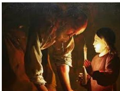
Georges de la TOUR