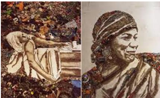
Vik MUNIZ « Waste Land »