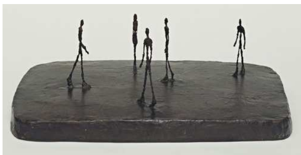
Alberto GIACOMETTI : La place I (city square)