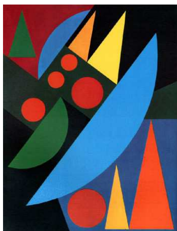
Auguste Herbin : " Pluie " - 1956