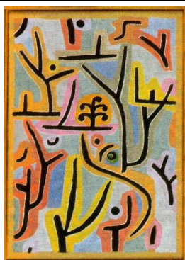
Paul KLEE « Parc près de Lucerne »

Photocopie remise : "squelette" de l'œuvre de référence. (Possibilité de l'épurer ?)