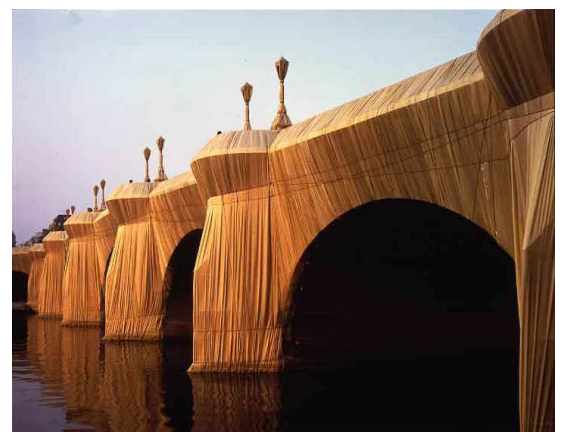
CHRISTO, Le Pont-Neuf à Paris emballé 1985