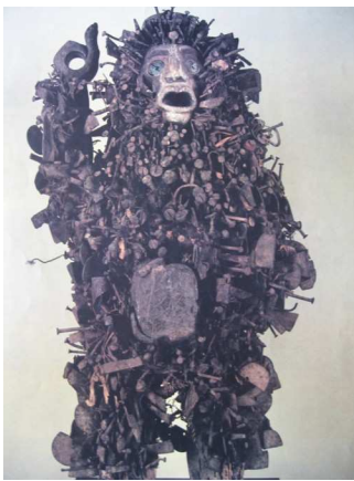
Zaire « fétiche Yombe »