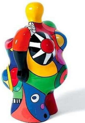
Niki de St Phalle