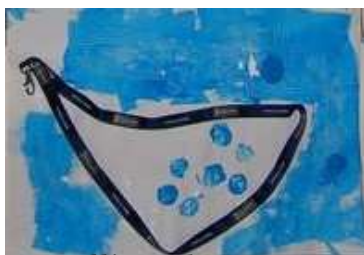
Un collier à la mer

PS école de L'Oie : Que devient ton objet lorsqu'il tombe à la mer ?