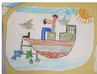
Le marin rêve...

Cycle 2 de Mallièvre: A quoi rêve le marin ?