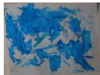
Une pince à la mer

PS école de L'Oie : Que devient ton objet lorsqu'il tombe à la mer ?